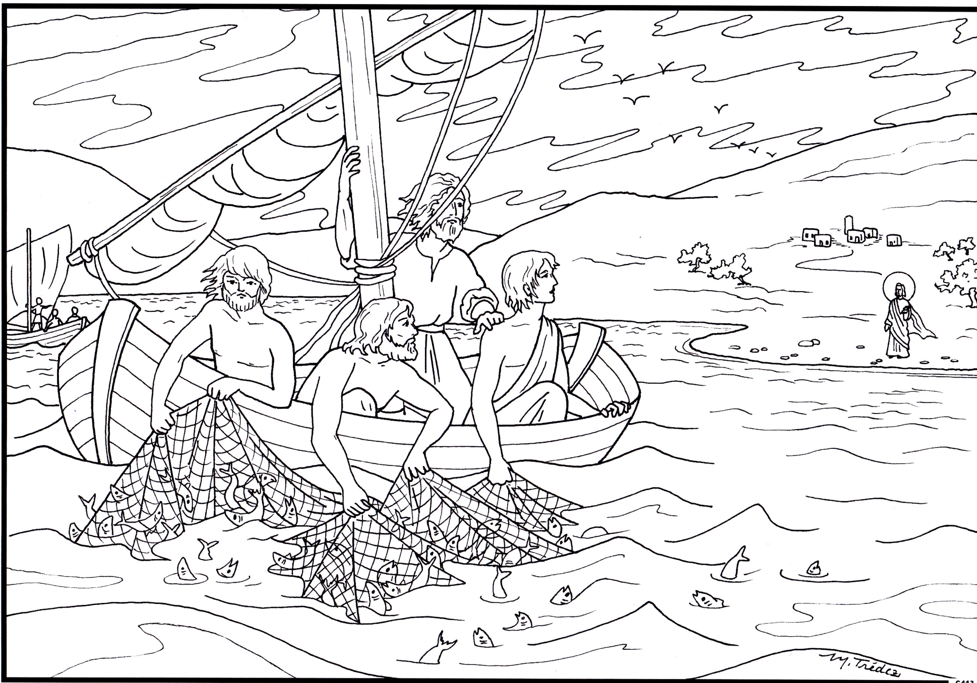
Jésus apparaît aux apôtres après sa Résurrection. (Jn. XXI - 7)