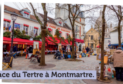
Place du Tertre à Montmartre.